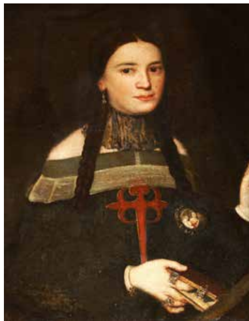
Fig. 3. Desconegut. Retrat de dama (ca. 1665-1700), oli sobre tela, 83,6 x 67,2cm. Sala de Naturals, Museu Palau Mercader, Cornellà de Llobregat, núm. inv. 2306.