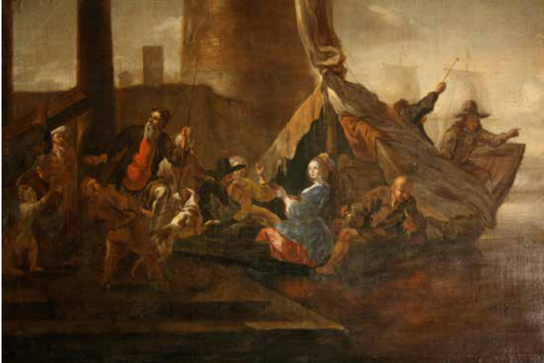
Fig. 6. Desconegut. Fantasia amb personatges dins d'una barca amb una jove que toca el llaut, segons Weenix (detall), segle XVII, oli sobre tela, 88,5 x 110,5 cm. Galeria del Museu Palau Mercader, Cornellà de Llobregat, núm. inv.485.

l'espatlla nua de la noia, en un gest molt seductor, que vol fer entendre l'estima que té per l'art musical.