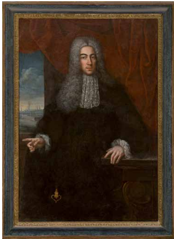
Fig. 5. Antoni Viladomat, atribuït, Retrat d'Antoni de Peguera i d'Aimeric (principis del segle XVIII), oli sobre tela, 161,8 x 120 x 6 cm. Saló dels Retrats del Palau Mercader, Cornellà de Llobregat, núm. inv. 792 (tradicionalment s'ha identificat el personatge reratat com a Magí IV de Mercader i Moragues).

tipologia alhora que eren valorats per si sols, tant per la riquesa com pel disseny del mateix moble. El disseny era volgutament ostentós i solien ser fabricats de dos en dos, per tant és summament interessant que hagi sobreviscut en el temps la parella, ja que normalment només se'n conserva un, però en aquest cas es conserven les dues arquetes. Pel que fa a la iconografia, els panells de vidre de vegades seguien un programa mitològic o bíblic i d'altres les escenes només mostraven figures en paisatges rocosos sense que hi hagués una voluntat narrativa. 17 Tradicionalment, la literatura artística ha atribuït al pintor Luca Giordano (1632-1705) molts panells pintats (González-Palacios 1984:223-231), però no s'ha pogut demostrar documentalment aquesta atribució, ni tampoc a cap dels artistes propers a ell. 18 És per això que per fer la catalogació els experts utilitzen la formula “a