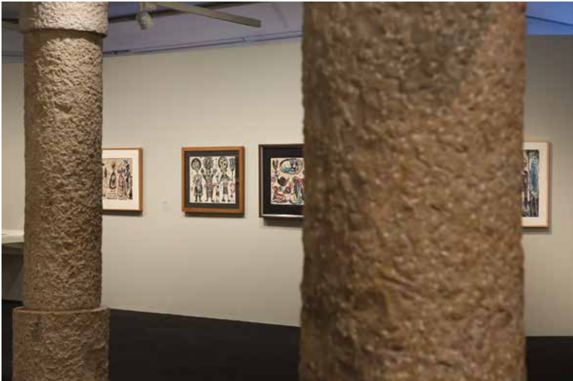
Fig. 1. Exposició Joan Ponç. Diàbolo a La Pedrera, Barcelona 2017-2018.

L'exposició, sempre seguint l'ordre cronològic que ens permet resseguir la seva evolució, arribats a l'any 1948 aborda l'aparició de Dau al Set. El grup format pel poeta Joan Brossa, el filòsof Arnau Puig (1926) i els pintors Joan Josep Tharrats (1918-2001), Modest Cuixart (1925-2007), Antoni Tàpies (1923-2012) i el mateix Joan Ponç, suposà amb la seva aparició una revolució dins del panorama artístic nacional. Partint de la força que desprèn l'interior de l'individu, és a dir d'un profund individualisme, la influència d'avantguardistes europeus com Paul Klee (1879-1940), Wassily Kandinsky (1866-1944) o Max Ernst (1891-1976) i de referents nostrats com Foix, Miró i Salvador Dalí (1904-1989), juntament amb l'ús de l'automatisme postulat pels surrealistes, els hi permeteren aportar llum i modernitat a un panorama artístic que havia quedat profundament ancorat degut a la situació política imposada pel règim franquista.