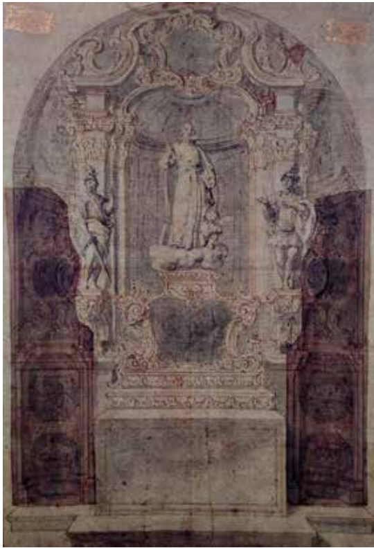
Fig.3. Francesc Tramullas, Traça de retaule dedicat a sant Gaietà . Col.Mercader (dibuix posat a contrallum)

decoratives lleugerament diferenciades per tal d'embellir l'espai de culte on l'obra estava destinada. Copsem en ambdues obres els mateixos protagonistes, però en el primer dibuix, per exemple, hi veiem uns angelets a l'àtic acompanyant uns gerros, que en el segon han desaparegut. La principal diferència entre les dues traces la veiem en el tancament dels cossos laterals. Mentre que en el dibuix descrit per Bassegoda apreciem una posició un xic reculada dels carrers o braços laterals respecte el cos central del moble, atorgant-li a aquest la preeminència. En el dibuix recentment trobat veiem com els cossos laterals s'atansen lleument en forma de curvatura cap endavant fins gairebé la mesa d'altar, apropant-se al fidel. Els subtils tocs d'aiguada grisa aconsegueixen recrear l'efecte realista i ombrívol de la planta