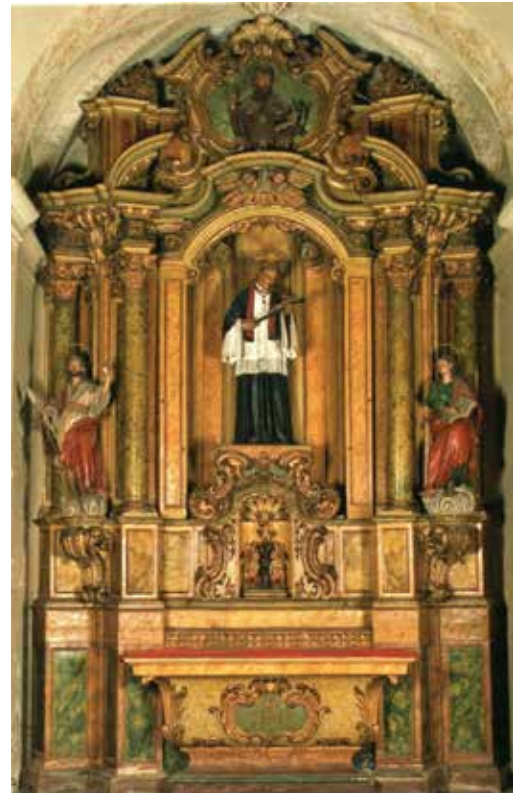
Fig.4 i 5-a. Esquerra, Retaule de la Verge del Roser i dreta Retaule de Sant Josep Oriol , església de Sant Sever, anònims, segona meitat segle XVIII. (Reprod. Subirana;Triadó 2008:112 i 113).