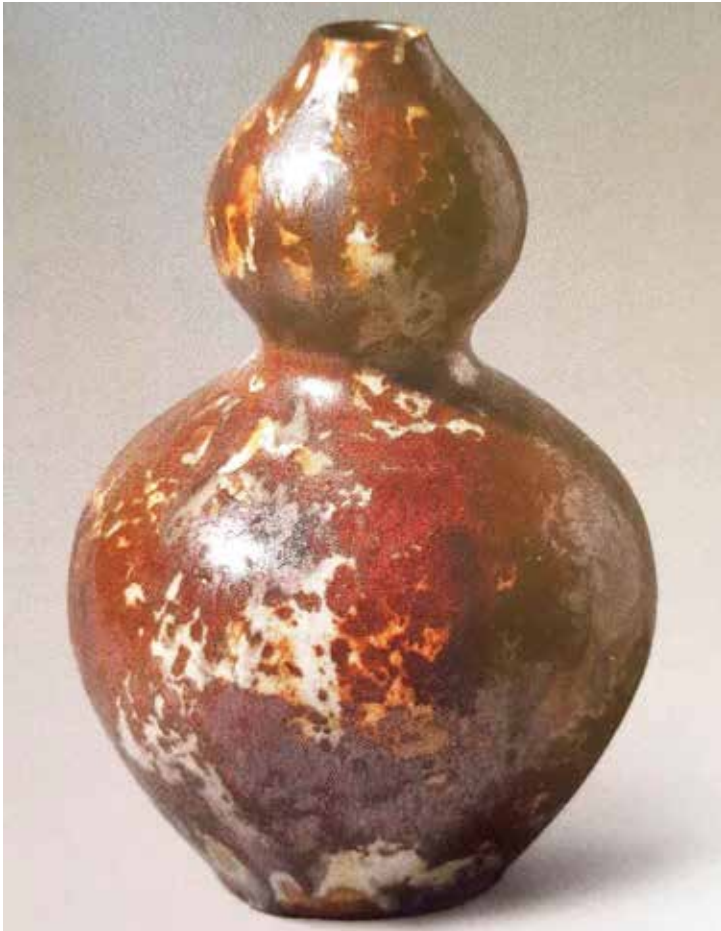
Fig.7. Francesc Elias, Gerro , ca. 1934-35, gres esmaltat, 30 x 19 cm. Museu del Disseny, MCB 14597.

La bona recepció que varen tenir aquestes peces a Barcelona, el va motivar a presentar-se al Primer Saló d'Artistes Decoradors organitzat pel Foment de les Arts Decoratives la primavera de 1936 i a la VI Triennial de Milà, on les seves ceràmiques de gres esmaltat van compartir espai amb diversos gerros de Llorens Artigas, aleshores ja àmpliament reconegut a l'estranger per les seves col·laboracions amb Dufy i com el ceramista català de més projecció i renom internacional (Gifreda 1936:7). No deixa de ser significatiu però, comprovar com la cotització dels gerros d'Artigas i els d'Elias era, en el cas de la Triennial de Milà, la mateixa. 25 Ja l'any 1933, en recordar el mestratge de Francesc Quer, Llorens Artigas va subratllar com aquest havia estat l'introduïdor de la ceràmica de gran art a Catalunya, de la qual, afegia, «resten com a continuadors l'esmentat Francesc Elias i el signant d'aquesta nota» (Llorens Artigas 1933:7). Certament, cal posar en relleu que, a l'època, l'obra d'Artigas i la d'Elias van ser vistes com a creacions paral·leles que marcaven el camí a seguir pels nous ceramistes d'art del país que es volien dedicar al gres esmaltat de gran foc.