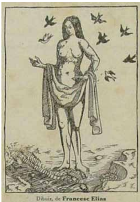
Fig.2. Il·lustració de Francesc Elias. Un enemic del poble , núm. 2, abril de 1917. Biblioteca Nacional de Catalunya

inspirats en els vasos catalans d'època barroca. 10