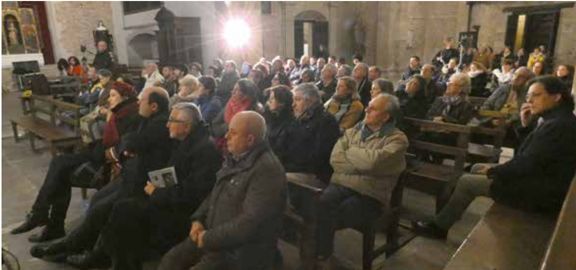
Fig.13. Asistentes a la presentación del Retablo del Diluvio en la iglesia Regina Coeli.