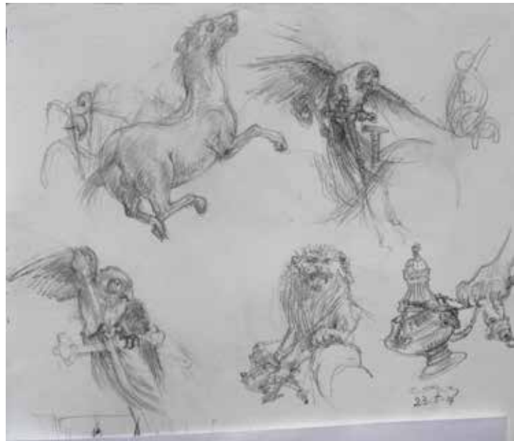
Fig. 3, 4, 5 y 6. Dibujos preparatorios para el Retablo del Diluvio .