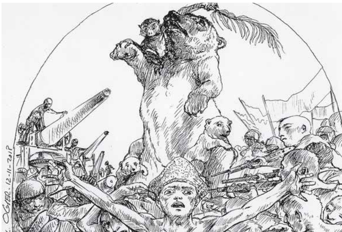
Fig.10. Dibujo preparatorio de la muerte del Oso.

abandono de los naufragos de la fragata La Médusa, destinada a recuperar el control de las antiguas posesiones francesas en África, por un barco de la marina francesa. No acudió a socorrerlos y la balsa fue a la deriva hasta que un carguero los rescató en un estado lamentable.