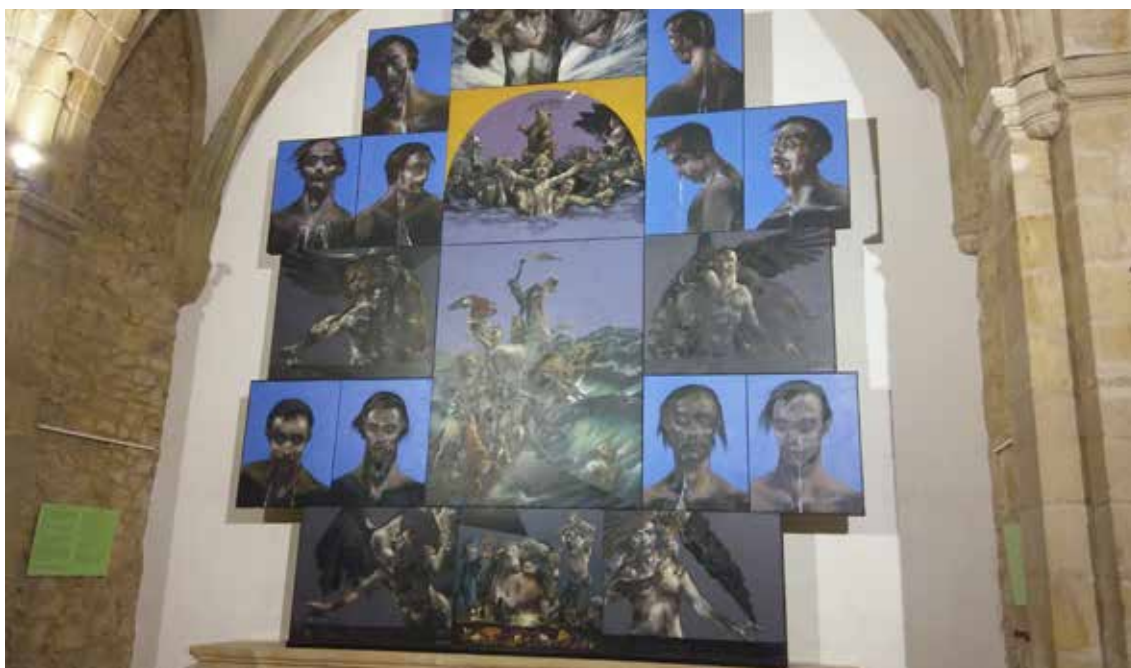
Fig.7. Retablo del Diluvio (2019).

En el siguiente nivel, sitúa en el centro a una nueva Natividad. Está representada por una pseudo virgen, de la cual sólo queda el velo azul. José, junto a sus atributos de obrero, lo sitúa al otro extremo. Los une en la expresión crispada, a través de unas manos retorcidas. Ambos sienten la desesperación ante un niño Jesús que no está en el lecho de paja y se ha refugiado entre los animales. Ogier enfatiza así que son los animales los únicos que desprenden paz, calma y cariño ante la venida del Hijo de Dios. La Pasión está representada por la forma geométrica negra, que cae sobre ellos como una apisonadora, un símbolo amenazador que no es otro que un trozo de la Cruz. Los huevos rotos recrean el prelude del tema, no hay esperanza para el hombre, sólo los animales serán los salvados en el próximo Diluvio. Los evangelistas San Mateo y San Juan flanquean una Natividad descorazonadora para el hombre.