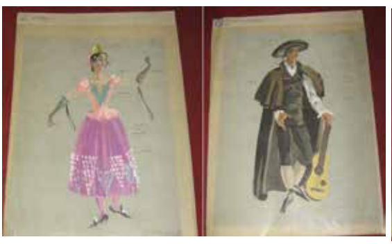
Lef: No. 6 "3.<sup>me</sup> Maya" Right: No. 3 "Jouer de Gitare".