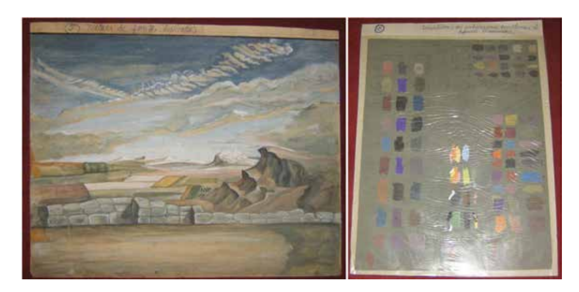
Left: No. 2 "Rideau de fond (duplicatta)" Right: No. 11 "Chantillons des couleurs pour les costumes de different personages"