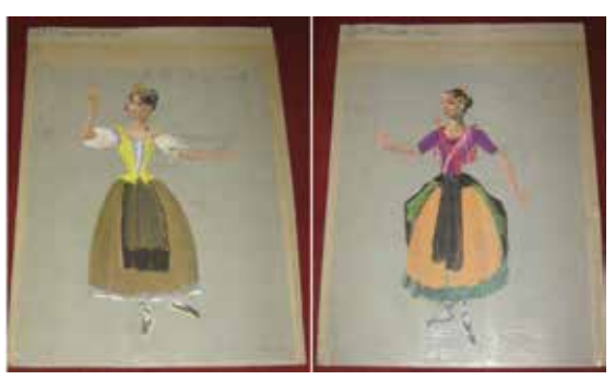
Left: No. 9 "1.er Paysanne Biche" Right: No. 10 "2.me Paysanne Biche"