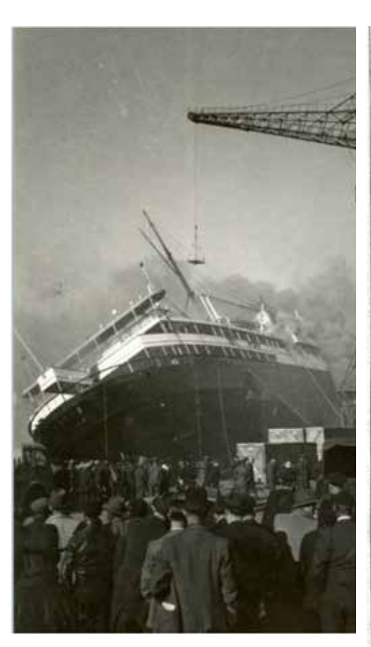
The luxury French liner "SS Paris" capsized in the Port of Le Havre, 18th April 1939.

Núm. 10, 2021 / 225-234 ISSN 2014-5667-Digital 2014-5675