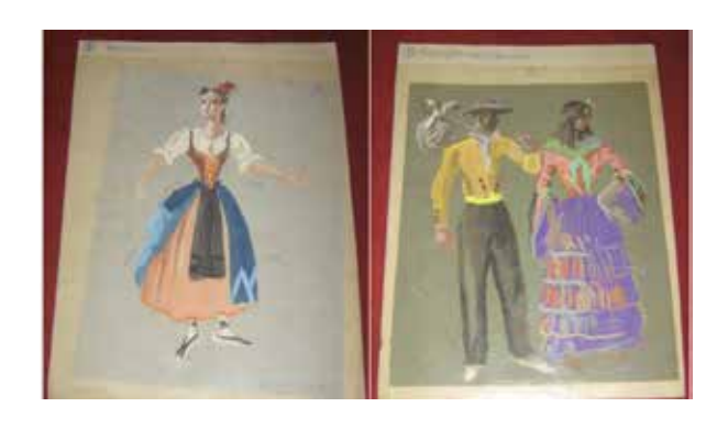
Left: No. 8 "Paysanne" Right: No. 7 "Couple (Principal) Tziganes"

Here a comparison between 'Massine' No. 8 (Paysanne) and an original work (No. 5) published in 1937<sup>17</sup>