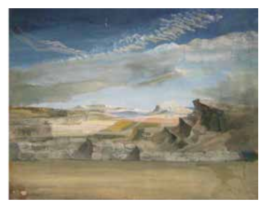
Stage Backdrop, by Mariano Andreu (52 x 64,5 cm. Inscribed on reverse, 'L'original, y compris le mur devant')

Later, on during my research, I came across the above mentioned reports in the French press that some of Andreu's designs for 'Les Ballets de Monte-Carlo' had been lost in the fire and subsequent capsizing of the French liner, "SS Paris".