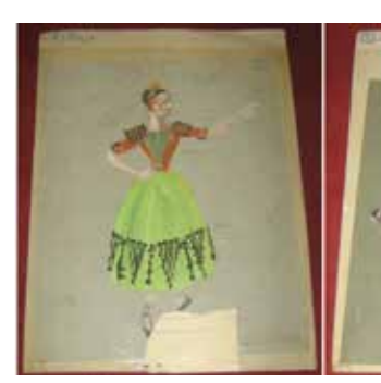
Left: No.1 "Maya" Right: No. 2 "2.me Maya"