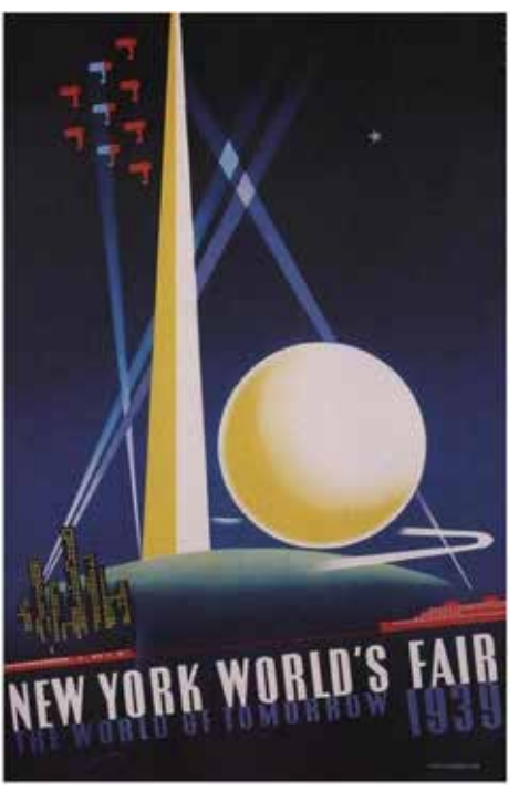
1939 Poster for the New York World's Fair.