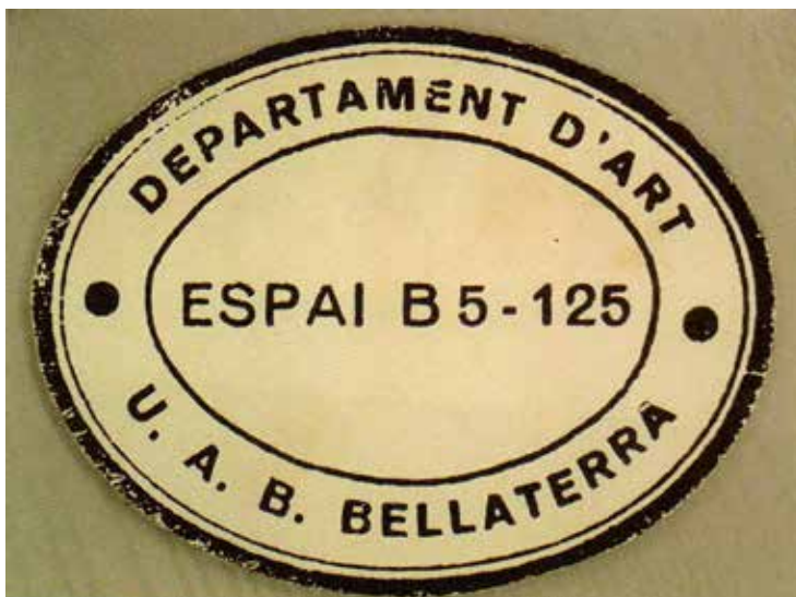
Fig. 7. Logotip de l'Espai B5-125.

Potser ara que ja han passat uns anys que podríem dir experimentals i que s'ha consolidat una manera de ser i de fer, ja es moment de pensar el lloc de l'art a l'Autònoma.