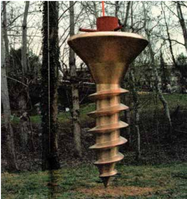
Fig. 5. Perejaume, Enclavament de Bellaterra , plaça Cívica (2007) Repr. Art Fora de l'Aula , Bellaterra, Universitat Autònoma de Barcelona, 2020, p.80.

Altres iniciatives, menys sistematitzades però igualment interessants han tingut lloc, com ara algunes exposicions de celebració d'aniversaris i especialment un fet molt singular que va rebre el nom de "La cara de l'Autònoma", un gran dibuix d'un rostre jove que volia sintetitzar el retrat de tota la gent de la Universitat.