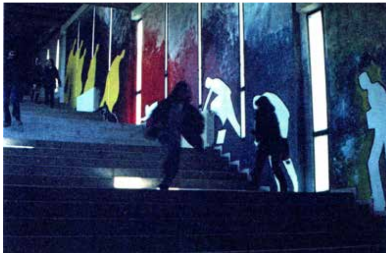
Fig.1. La pintada , Facultat de Filosofia i Lletres (1975). (Repr. Art Fora de l'Aula , Bellaterra, Universitat Autònoma de Barcelona, 2020, p.90.

Es tractava d'una iniciativa que pretenia posar en relació l'art actual i els seus autors amb els futurs historiadors i comentaristes, és a dir i ara per ara, els estudiants de la Titulació d'Art, però no solament ells, sinó també implicava a tot el personal de la casa —professors, estudiants, administratius, PAS, visitants—. Aquesta relació de contacte amagava la pretensió de trencar l'aïllament habitual entre els dos sectors i obrir el territori de la Universitat a la presència d'obres i artistes actuals. Aproximar l'art actual i els seus creadors al públic hipotèticament més interessat, aquell en període de formació en el marc dels estudis universitaris humanístics i de tot ordre que imparteix la institució acadèmica.