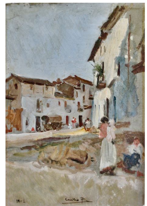
Fig. 5 C ecilio Pla, Placeta de poble, 1902, Col·lecció particular

Quina és l'obra que l'artista va realitzar primer, el dibuix aquarel·lat o l'oli? Va convertir la il·lustració publicada a Blanco y Negro –desproveïda del seu caràcter costumista– en l'oli Placeta de poble o, per contra, situà l'escena final de la Doloretas en aquella mateixa plaça que prèviament ja havia pintat? No ho sabem del cert, però, en qualsevol cas, és obvi que Cecilio Pla aprofità el mateix tema de fons per realitzar ambdues composicions, pràctica, d'altra banda, força habitual en l'obra de molts artistes.