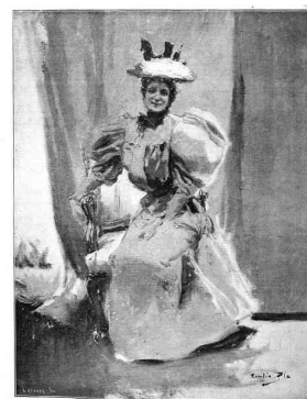
ESTUDIO PARA UN RETRATO POR CECILIO PLA