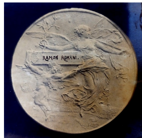
Fig. 7 Detall de fotografia manipulada d'Eusebi Arnau, autor de la medalla de l'Exposició del 1888. Enlloc de la data, trobem a la primera plana de l'Àlbum el nom del seu propietari.