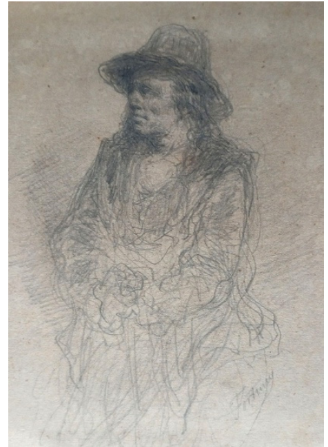
Fig. 9 (A dalt) Atribuït a Marià Fortuny i Marçal. S/N, Dos estudis de figures masculines. Dibuix a llapis sobre paper. Pàgina 7 de l'àlbum. c. 1880.