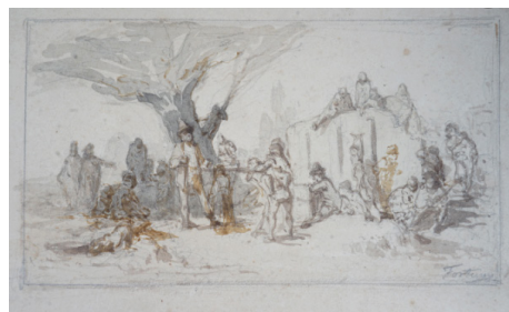
Fig. 8 Marià Fortuny i Marçal. S/N, Duel o execució. Aquarel·la sobre paper encolat. Pàgina 5 de l'àlbum. c. 1880.

també com un mostrari de la varietat de suports que s'el·laboraven a les diverses fàbriques papereres de la família Romani. En conjunt, la col·lecció de dibuixos (i també una petita pintura a l'oli) conforma un conglomerat d'obres –algunes més acabades i d'altres més ràpides, com apunts o esbossos– d'artistes heterogenis que s'emmarquen cronològicament entre la pintura natzarena i el tardoromanticisme finisecular. Per fer-ho més entenedor llistem a continuació els noms dels artistes identificats i el nombre de peces realitzades. Aquesta llista difereix de la donada per la subhasta ja que hem identificat la majoria d'artistes de noms desconeguts com per exemple: “Kirman” és Arnau; “Brugllerd” és Bruguera; “Famburins” és Tamburini; “Barras” és Barrau; “Padra” és Padró; “Lamina” és Camins; “Salazet” és Salayet, etc.