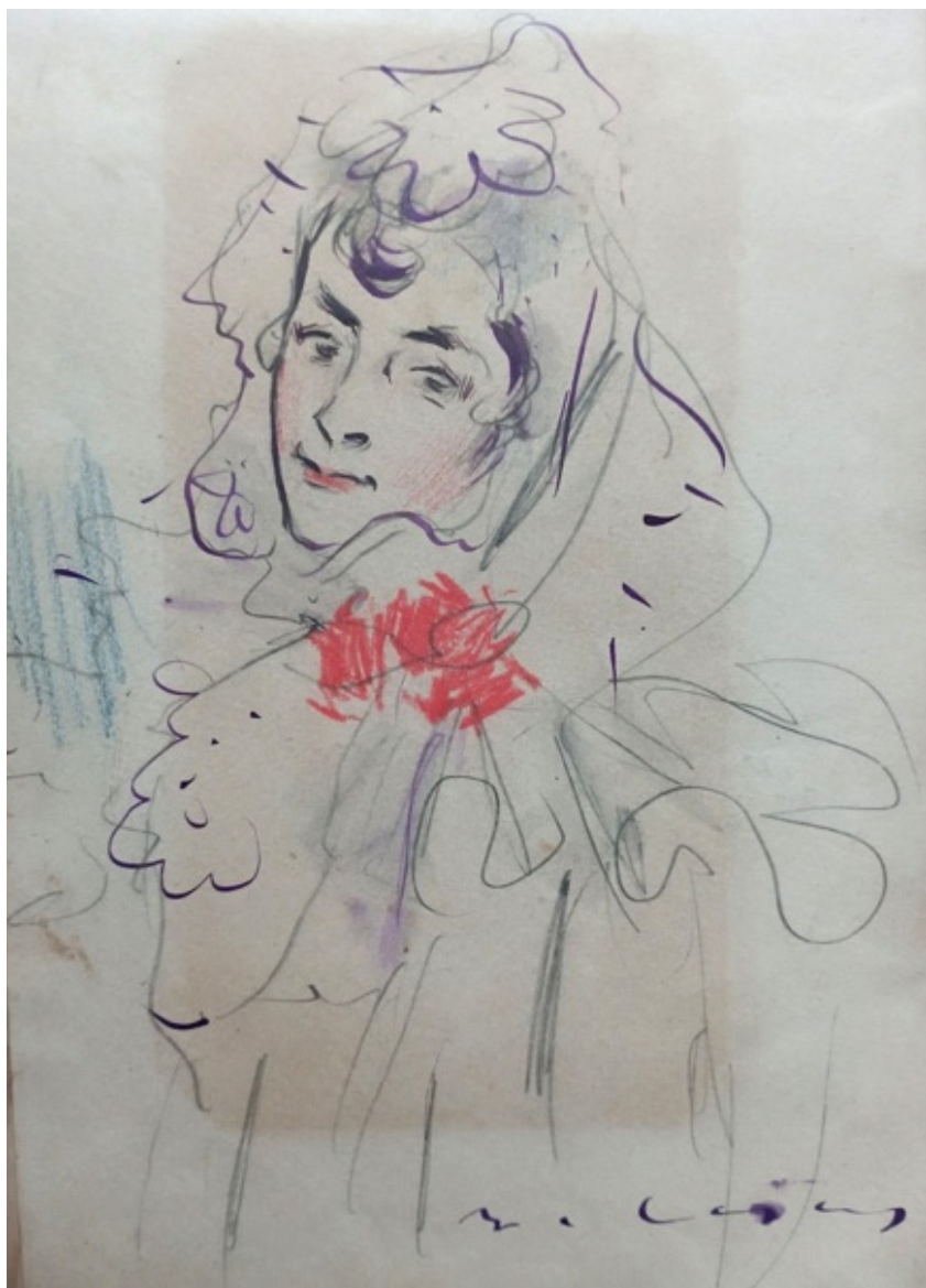
Fig. 20 Ramon Casas. S/N, Retrat d'una dona. Aquarel·la, tinta porpra i dibuix encolat. Pàgina 2 de l'àlbum. c. 1880-90.

Fig. 18 Atribuït a Eusebi Arnau. S/N, Figura admirant una escultura ornamental amb una serp i un drac. Pàgina 20 de l'àlbum. c. 1880-90.