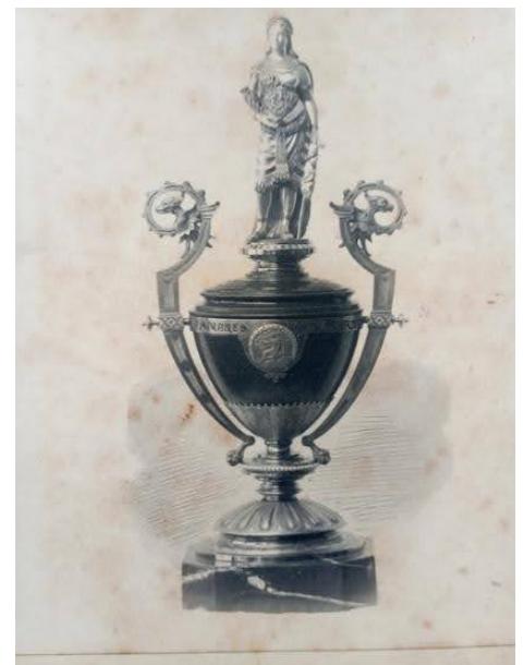
Fig. 5 Litografia de l'Àlbum Romaní dels Napoleón amb el Premi de l'Exposició del 1888.