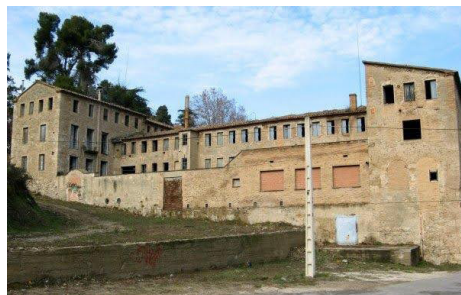
Fig. 6 Fotografia actual de Can Romaní a Capellades (Anoia), amb estructura fabril sobre antic molí paperer.