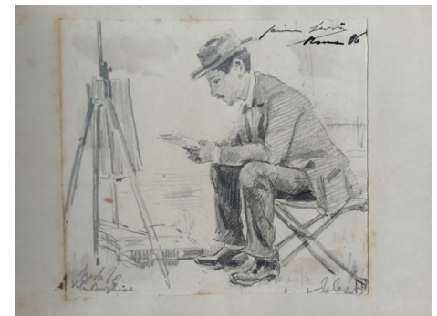
Fig. 32 Fèlix Alarcón Brenes. S/N, Barques i figura (amb inscripció "a mon amich Serriña"). Dibuix a llapis grafit. Pàgina 11 de l'àlbum. 1886.