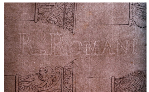
Fig. 4 Paper verjurat amb filigrana o marca d'aigua de "R. Romaní" cap a 1850.