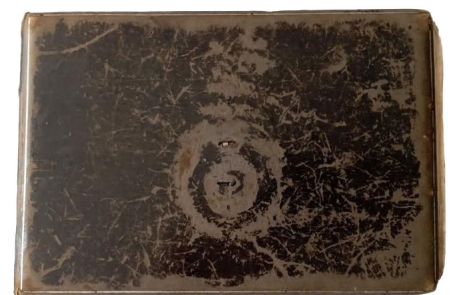
Fig. 1 Coberta de l'Àlbum de Ramon Romaní i Puigdengolas (Col. Mercader).